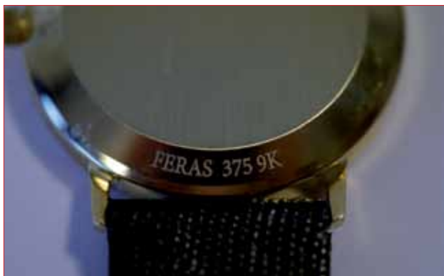
Gull-ur med påført finhetsmerke.

Produsenter, grossister, importører og selgere har ansvaret for at varene som selges som edelmetall oppfyller lovens krav om finhet og merking. Ur av edelt metall dekkes også av loven.