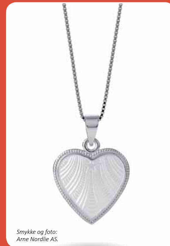
Smykke og foto: Arne Nordlie AS.