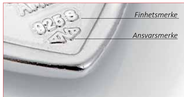
Del av kjedesmykke, hvor finhets- og ansvarsmerke er påført. Smykke og foto: Arne Nordlie AS.

Hvis en vare av edelt metall har en finhet som ligger mellom to definerte standarder, skal finhetsmerket stemples med den nærmeste lavere definerte standard.